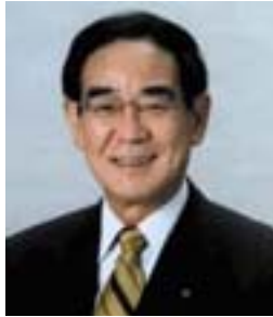
가와사키 시장 아베 다카오

가와사키는 일본 최대의 소비지인 수도권의 중앙부에 위치하며, 동경 남쪽에 인접하여 교통이 매우 편리한 도시입니다.