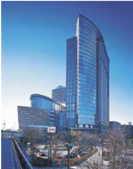
국제적 음악 홀 / 유자 가와사키 심포니 홀 (좌)