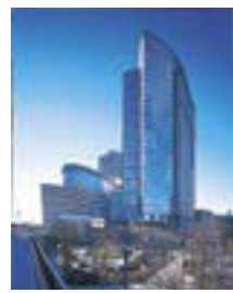
유자 가와사키 센트럴 타워

외자계 기업 입지수 : 115개사 (가와사키시 파약분, 중 본사 83개사는 전국 제5위의 규모를 자랑한다) 참조 : ①동경23구 ②요코하마시 ③오사카시 ④고베시 ⑤나고야시