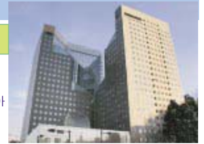
슬리트 스퀘어 빌딩