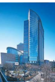
Muza Kawasaki Central Tower

Nihon L'Oreal (trung tâm nghiên cứu phát triển) Fuji Zerox (nhà máy) Fuji Zerox Information System (văn phòng)