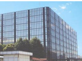
Techno-hub Innovation Kawasaki (THINK)

Giúp giảm gánh nặng đồng thời tạo thuận lợi khi khởi sự kinh doanh