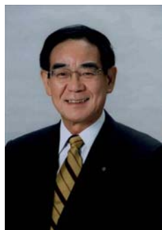
Thị trưởng Kawasaki