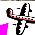
Sân bay Haneda