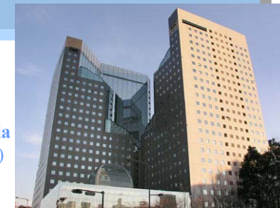
Solid Square Building