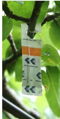
天敵（カブリダニ）の入った袋を枝に掛ける

市では、平成12年3月に「川崎市環境保全型農業推進方針」を策定し、環境保全型農業を推進しています。