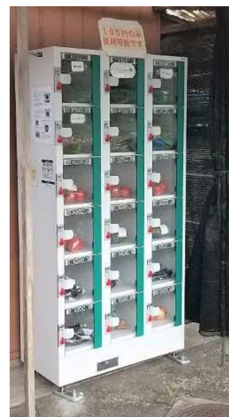
園内生産物の販売（自販機）