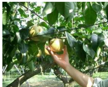
園内ナシ園（収穫前の様子）