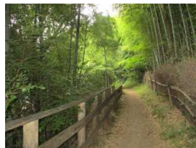
多摩自然遊歩道 (多摩美)