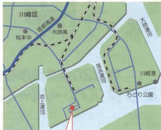
三栄レギュレーター(株) 東京工場の所在地：川崎市川崎区水江町6番10号

紙にプリント、エンボス（紙の表面にでこぼこをつける）加工し、製品の大きさにカットします。