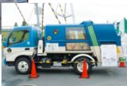
子どもたちに大人気の スケルトン車→

ごみと資源物の正しい分け方や出し方を学ぶ“分別ゲーム”では、ごみを分別の種類ごとに分けてカゴに入れてもらい、正しく分別できたか答え合わせをしながら、空き缶やペットボトルなどの資源物が、どのように処理され、新たな製品にリサイクルされるのか説明します。また、ごみ収集車の内部が見えるように改造した通称「スケルトン車」で、ごみ収集作業の実演も行います。