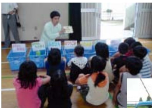
↑ 分別ゲームの様子

主に小学4年生を対象に、学区内のごみ収集を担当する生活環境事業所の職員が小学校に出向き、社会科や総合学習などの時間を活用してごみに関する授業を行っています。