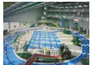
(写真はヨネッティー王禅寺)

ごみ処理施設の余熱を有効に利用した温水プールは冬でも泳げて寒さ知らず。高齢者用休養施設やトレーニングルーム(ヨネッティー王禅寺のみ)なども併設しており、思い思いのリフレッシュができます。