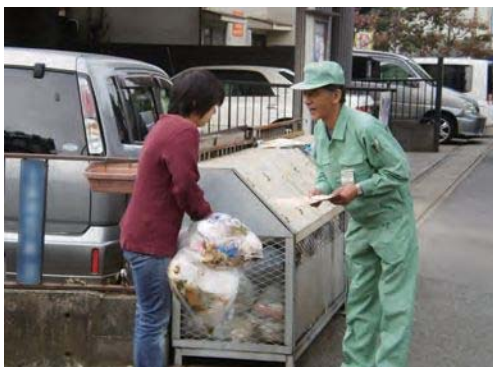
統一排出指導イメージ

10か月分のミックスペーパー収集量合計……………8,713トン 10か月分のプラスチック製容器包装収集量合計……………3,204トン 10か月分の普通ごみ減少量(前年度同月比)合計……………16,760トン