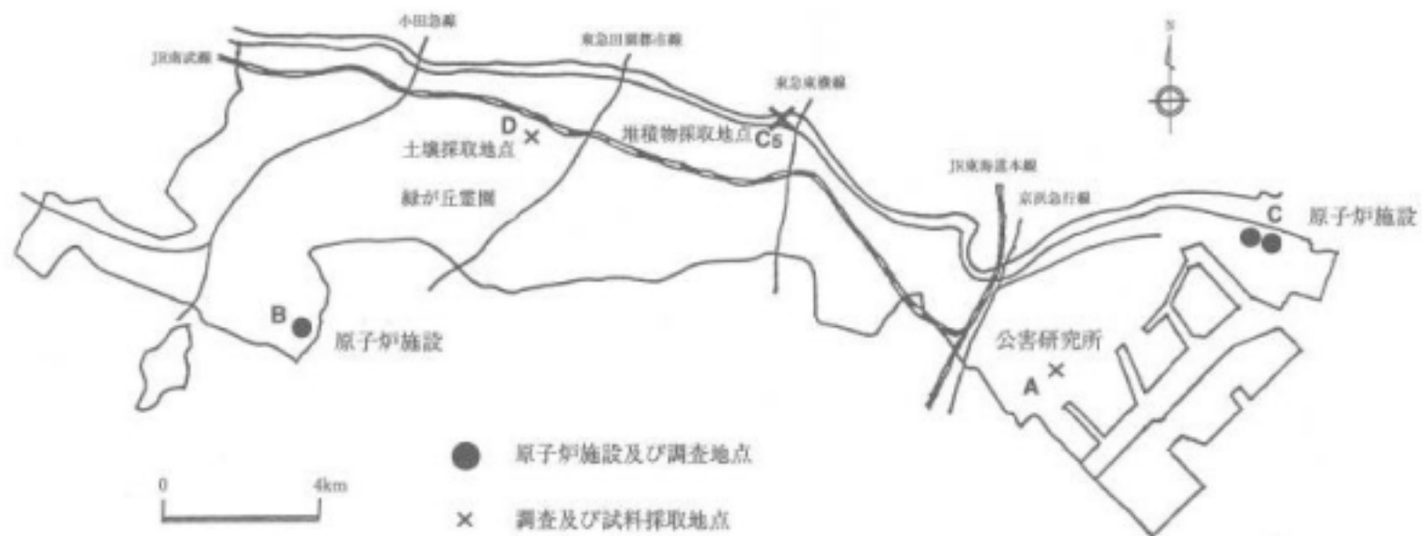
図1 川崎市内の原子炉施設及び調査地点