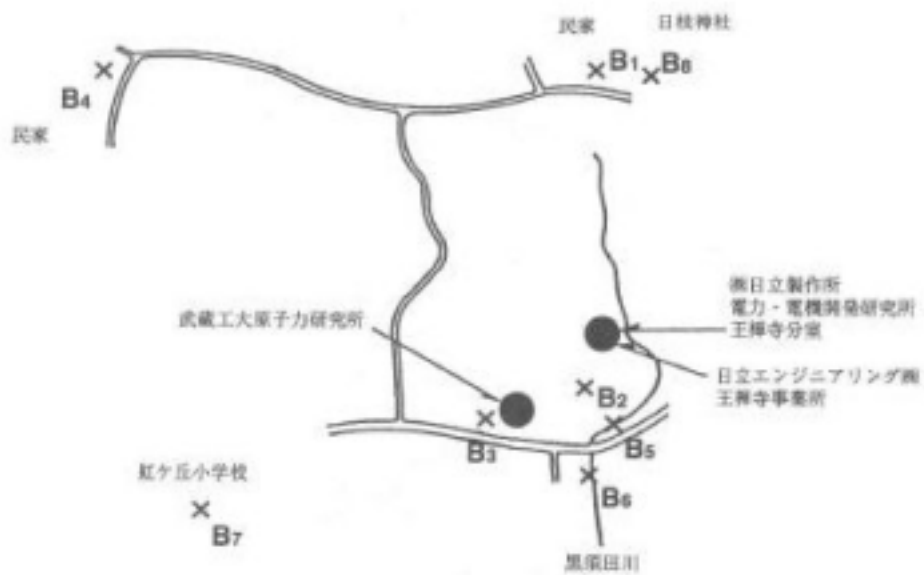
図2 王禅寺地区の試料採取地点及び空間放射線量測定地点