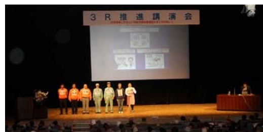
生活環境事業所による取組事例紹介