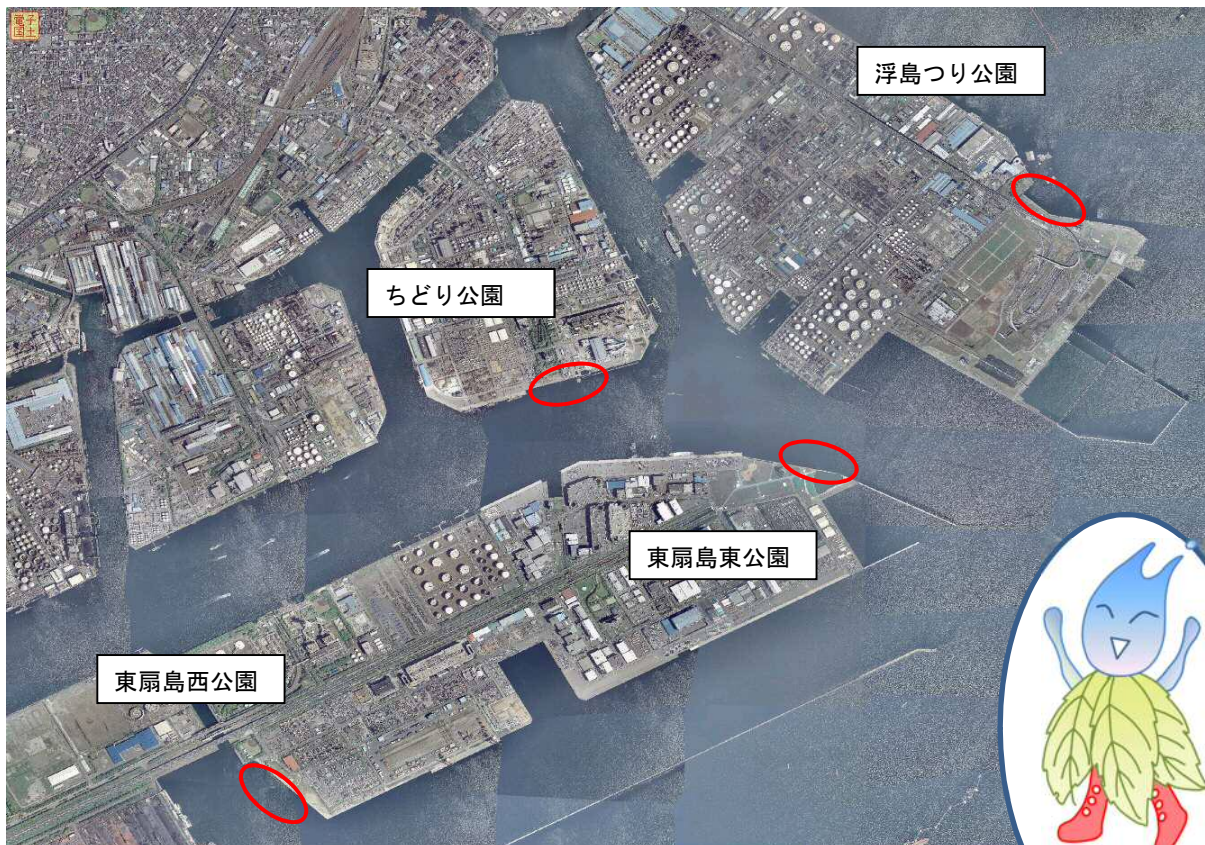
調査した公園の位置