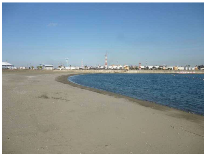
東扇島東公園 (かわさきの浜)