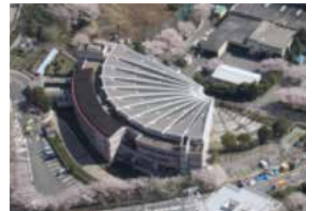
ヨネツティー王禅寺全景

利用者の皆様には大変ご不便をおかけしますが、ご理解、ご協力の程よろしくお願いいたします。