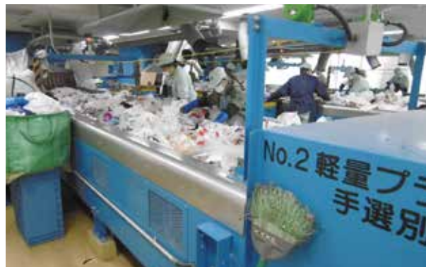
手選別作業の様子

資源化処理施設では、収集したプラスチック製容器包装の中に異物(刃物類や注射針、乾電池など)が混ざっていないか、作業員が手選別をしています。そのため、異物の混入によって作業員がケガをする恐れがあるほか、異物が火災の発生や機械等の故障の原因にもなりますので、絶対に混ぜないように、引き続きご協力をお願いします。