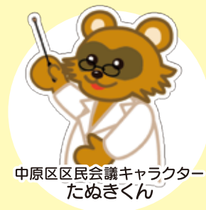
中原区区民会議キャラクター たぬきくん

〈川崎市HP( http://www.city.kawasaki.jp/ )から「中原区区民会議」で検索〉