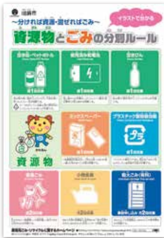
リーフレット表紙

市民の皆様には資源物とごみの分け方等についてより理解を深めていただくため、絵やピクトグラム(絵文字)を使って分別ルールを説明したリーフレットを作成しました。