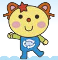
かわさき3R推進キャラクター かわるん

「川崎市一般廃棄物処理基本計画」に基づく市の取組や、ごみ減量・リサイクル等に役立つ情報を紹介します。