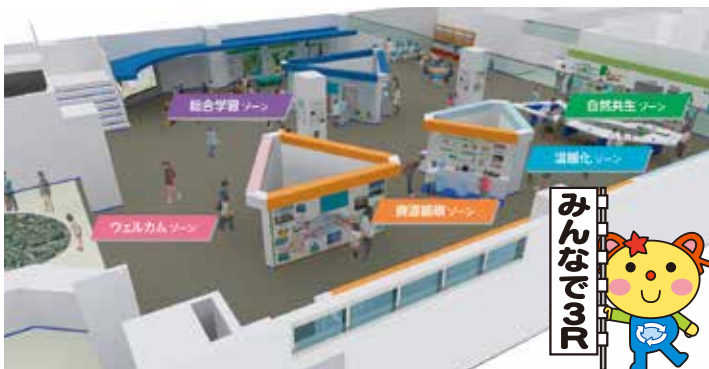
環境学習施設(資源化処理施設内)完成イメージ ～環境について、見て、聞いて、さわって、体験しながら学習できます!～

また、平成28年3月には「環境学習施設」の完成式典、内覧会の実施を予定しています。