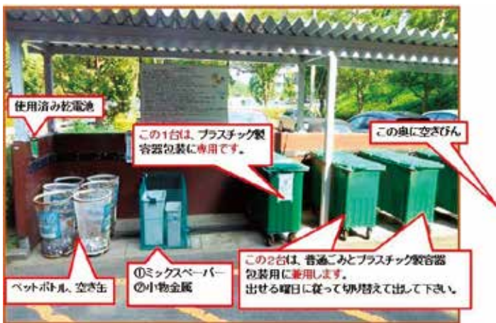
(さつき第2自治会の資源物・ごみ集積所の様子 撮影及び写真中のコメントは広谷指導員による。)

事業所からの話が終わると、広谷指導員から集積所の改善方法について提案があり、住民の皆さんによる意見交換が行われました。内容は、プラスチック製容器包装の排出が増え、従来の専用コンテナだけでは取まらなくなったことへの対応として、「コンテナの一部を曜日によってプラスチック製容器包装と普通ごみの共用とする」ことにより、集積所の有効活用と美観向上を図ろうとするものでした。普段から分別方法の指導と集積所美化に力を入れているさつき第2自治会ですが、その陰には減量指導員と住民の皆さんのこうした地道な努力があります。