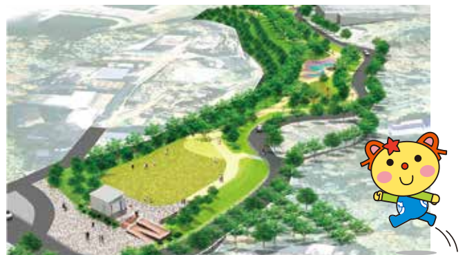
緑地広場完成イメージ ～いつでも、だれでも自由に出入りできる緑の空間～