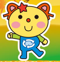
かわさき3R推進キャラクター かわるん

「川崎市一般廃棄物処理基本計画」に基づく市の取組や、ごみ減量・リサイクル等に役立つ情報を紹介します。