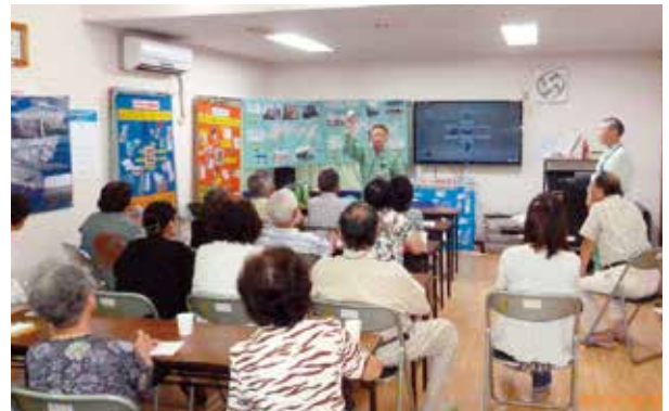
(プラスチック製容器包装の現物を手に説明)

当日事業所からは、分別収集を開始してから約2年たつプラスチック製容器包装の話を中心に、皆さんに分別方法についてもう一度確認していただくため説明させていただきました。