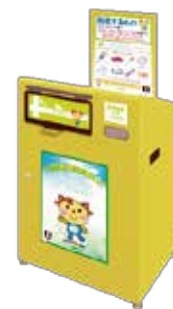
小型家電回収ボックス