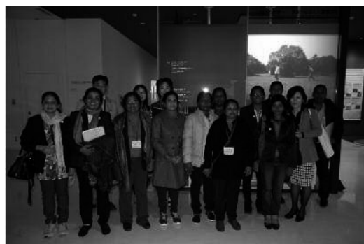
視察受入れの様子