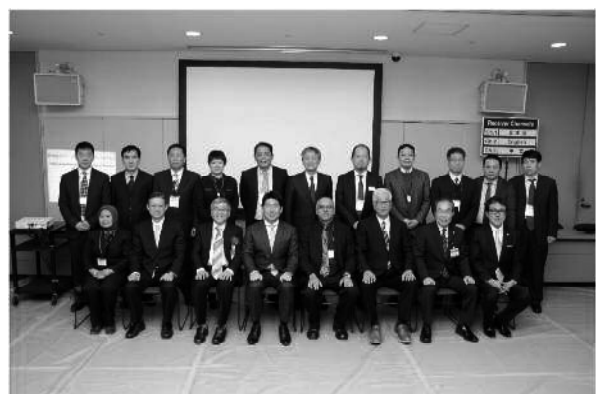
「第12回アジア・太平洋エコビジネスフォーラム」の様子