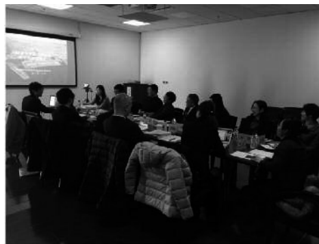
瀋陽市でのセミナーの様子