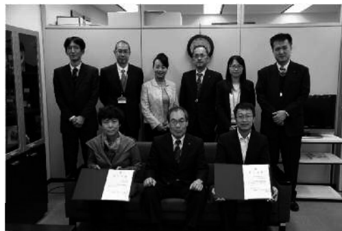
研修生と環境局職員

第18回目となる2015年度は、2015年10月25日～11月22日（29日間）の日程で2名の研修生受入れを行い、環境行政研修、企業等視察を行った。