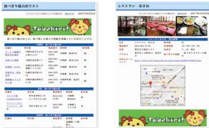
(H29 6月現在 34店舗が登録)

登録しているお店のなかには、小盛メニューの提供や、注文に応じてご飯の量を減らして提供しているお店もあります。「食べきり協力店」を積極的に活用して、食べ残しを減らしましょう！