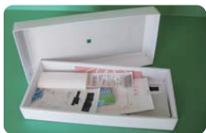
※出すときには、ふたや封を閉じてください