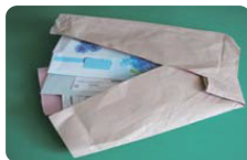
包装紙などに包む