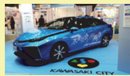
▲燃料電池自動車 展示・同乗体験