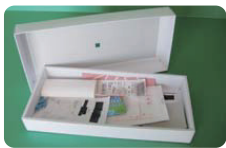
※出すときには、ふたや封を閉じてください