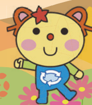
かわさき3R推進キャラクター かわるん