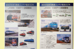
▲クリーンかわさき号 パネル展・記念撮影会