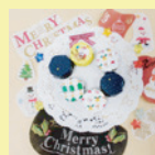
クリスマスライト 工作教室

★各イベントの開始時間や参加方法等の詳細については、HPをご覧ください。電話等でお問い合わせください。なお、整理券の配付は当日9時から行います。