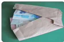
包装紙などに包む