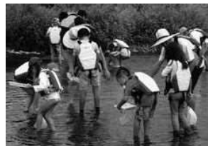
川の中の生きものコーナーの様子

※お弁当・飲み物・タオル・着替え等は各自でご用意ください。詳しくはホームページをご覧ください。