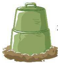
コンポスト化 容器