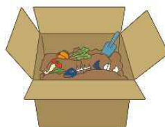
ダンボール コンポスト