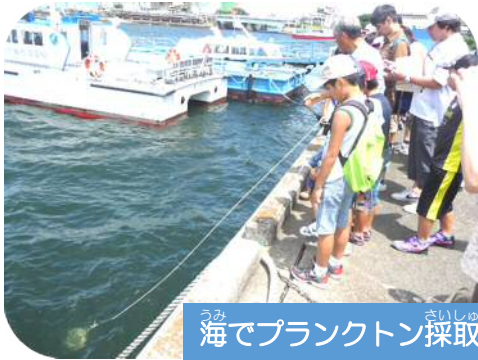
海でプランクトン採取