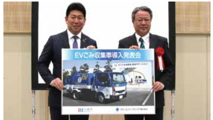
EVごみ収集車導入発表会の様子