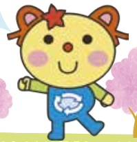
かわさき3R推進キャラクター かわるん