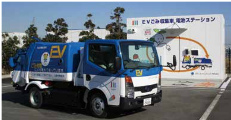
EVごみ収集車と電池ステーション