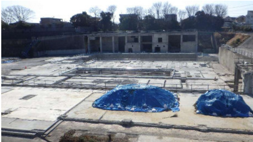
① ごみ焼却処理施設1