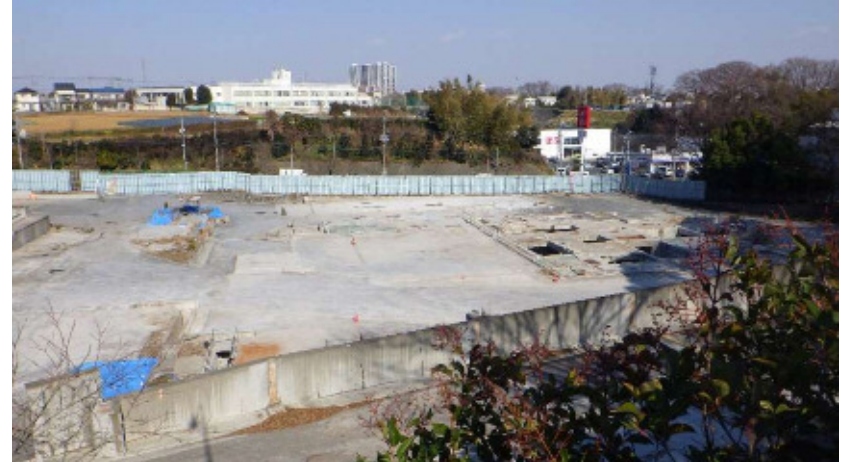
③ 粗大ごみ処理施設