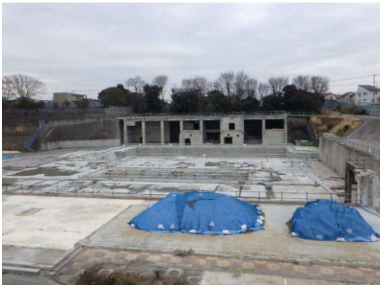
② ごみ焼却処理施設2