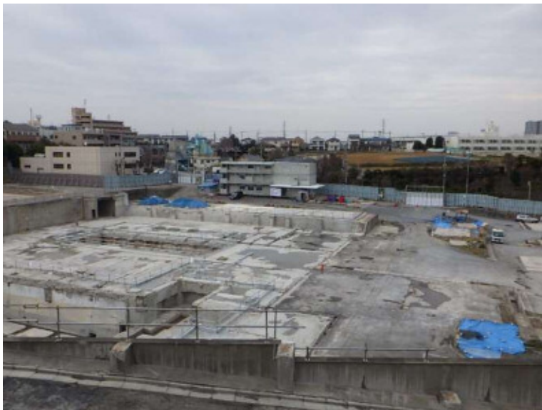
② ごみ焼却処理施設2