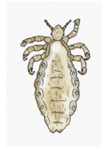
アタマジラミ 成虫