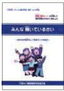
「みんな輝いているかい」 (高学年むけ)