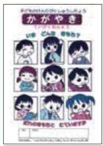
「かがやき」 (低学年むけ)