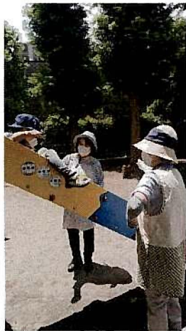
〈公園遊び安全見守り〉