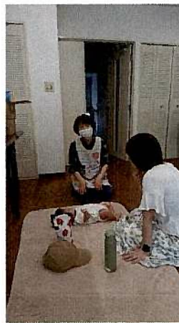
〈おむつ替え時の懇談〉