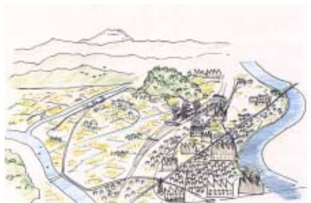
高度成長期の幸区