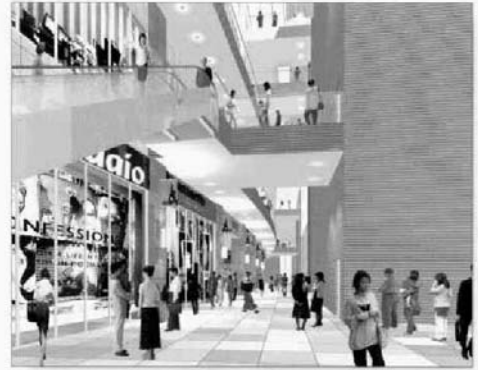
小杉駅南部地区の完成イメージ

(1) 本市の広域拠点として、商業・業務市街地や複合市街地などにおいて、商業・業務、文化・交流、医療・福祉・教育、研究開発等の諸機能集積と都心にふさわしい優良な都市型住宅の建設を適切に誘導し、土地の計画的な高度利用を図り、職住の調和した質の高い複合市街地の形成をめざします。