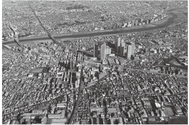
平成20年度 川崎市撮影

(3) 高層ビル、ターミナル駅の安全確保対策を検討し、建築物所有者に対して安全対策を促進します。