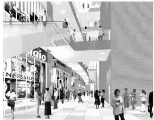
武蔵小杉駅南口地区西街区パンフレットより抜粋