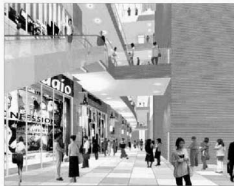
小杉駅南部地区の完成イメージ

(1) 本市の広域拠点として、商業・業務市街地や複合市街地などにおいて、商業・業務、文化・交流、医療・福祉・教育、研究開発等の諸機能集積と都心にふさわしい優良な都市型住宅の建設を適切に誘導し、土地の計画的な高度利用を図り、職住の調和した質の高い複合市街地の形成をめざします。