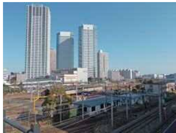
新川崎地区・操車場跡地

・新川崎地区（操車場跡地）と隣接する周辺市街地では、住環境の向上をめざす住民の発意による主体的なまちづくり活動を支援します。