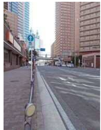
無電柱化された街路