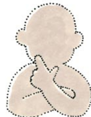
たちば ★いろいろな立場を じぶん かんが 自分で考えてみよう!