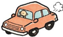
くるま つか ひと ★車をよく使う人