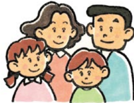
かぞく ★家族みんな