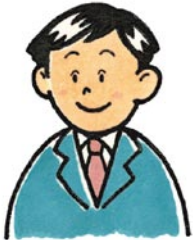
かいしゃ はたら ひと ★会社で働く人