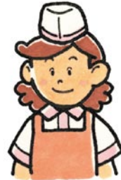
みせ はたら ひと ★お店で働く人