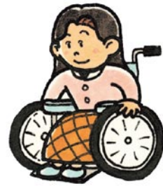
くるまいす つか ひと ★車椅子を使う人