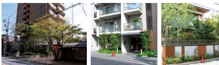
街道に面した様々な植栽の事例