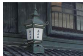
和のデザインの灯りによる風情のある街なみ