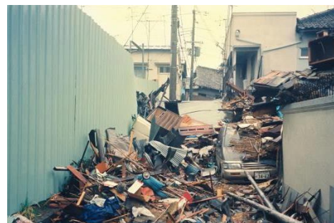
阪神・淡路大震災の被害の様子