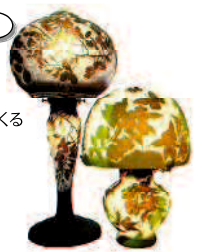
サンドアートガラス

区内には、まだまだ、たくさんの面白いものづくり企業があります。ぜひ探してみてください。また、坂戸には、最先端技術の研究開発を行う企業や新しい分野を切り開く企業などが集まった日本初のサイエンスパーク「かながわサイエンスパーク(KSP)」もあります。