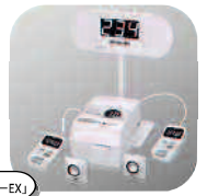
窓口受付システム「アイキューEX」

役所や銀行などで「順番に受け付ける」機械や「お札を数える」機械をつくっています。