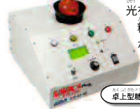
車上型糖度計「アマイカプロ」