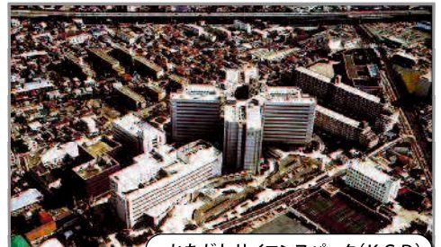
かながわサイエンスパーク(KSP)

区内には、まだまだ、たくさんの面白いものづくり企業があります。ぜひ探してみてください。また、坂戸には、最先端技術の研究開発を行う企業や新しい分野を切り開く企業などが集まった日本初のサイエンスパーク「かながわサイエンスパーク(KSP)」もあります。