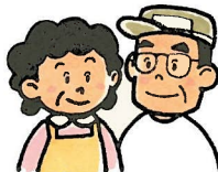
ちいき ひと 地域の人