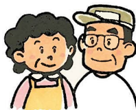
ちいき ひと 地域の人