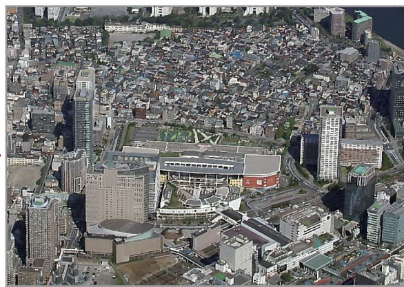
1984年(昭和59年)ごろの川崎駅西口の様子