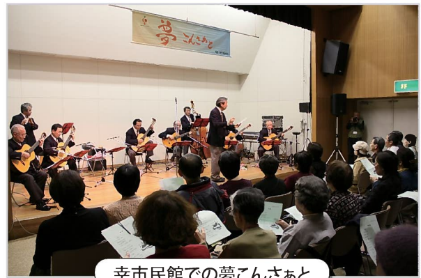
幸市民館での夢こんさあと

しめるコンサートを。」そんな思いで、1997年 (平成9年)から地域の人たちが中心となって、お 昼どきのコンサートを開いています。区役所と地 域の人が協力しあって行う「夢こんさあと」とし て親しまれ、2015年(平成27年)6月には