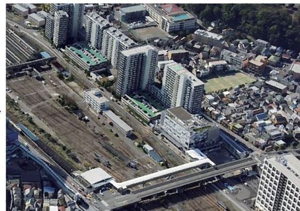
1983年(昭和58年)と2014年(平成26年)の様子