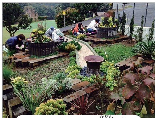
ポケットパークでの花壇づくり

まず取りかかったのは、宮前平駅から宮前区役所に向かう長い坂の途中にある、ポケットパークに花を植える花壇づくりです。花壇づくりをしていると「きれいになりましたね。ありがとう。」と声をかけられるようにな