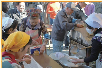
イベント企画・運営