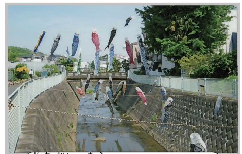
自治会に寄付されたこいのぼり

五反田自治会のこれらの活動は、道に伸び放題で街灯まで覆っていた3本の木をみんなで協力して切り、花壇をつけたことから始まりました。