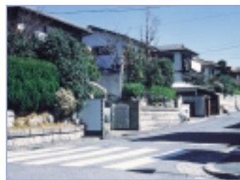
さくは緑に しているんだね