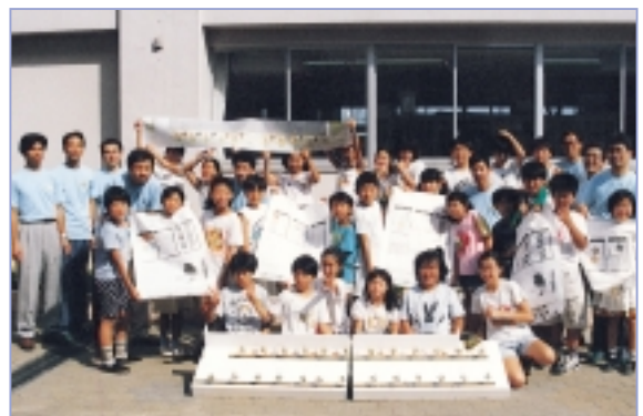
もけい 模型も登場！