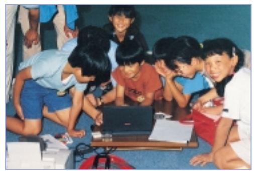
いろえんぴつ 色鉛筆やパソコンでシートを作成