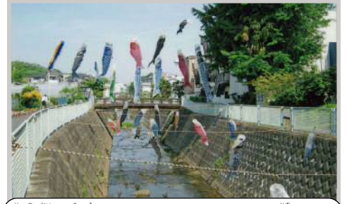
自治会に寄付されたこいのぼりをみんなで飾ります

四季折々の花を植えると、通る人たちが花壇を見ながら歩くようになりました。そこで、「花と一緒にまちの歴史や出来事を見て、知ってもらおう」と、花壇に掲示板を立てると、立ち止まって見る人が増えてきました。そこで今度は、話をしながら休憩できるベンチをつくりました。さらに、こうして声をかけあう輪が広がり、次々に新しい活動が生まれました。