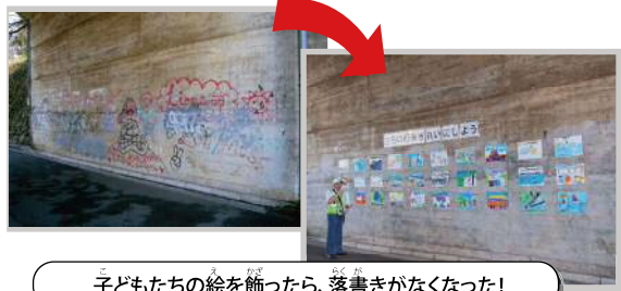
子どもたちの絵を飾ったら、落書きがなくなった！

一方、落書きが絶えずこわい雰囲気になっていた五反田川沿いの生田大橋の下のトンネル。大学生と三田子ども文化センター、五反田自治会、川崎市が協力して落書きを消し、子どもたちが「わたしたちが見た・思う生田のまち」の絵を描いて飾ったところ、落書きはぱったりなくなりました。大人だけでなく、子どもたちも地域でできることがあるのですね。