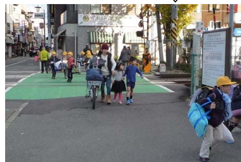
安全・安心に通行できるようになった向河原駅前踏切