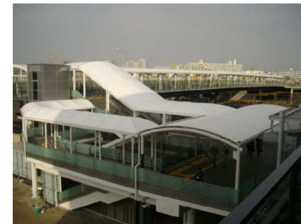
鹿島田こ線歩道橋