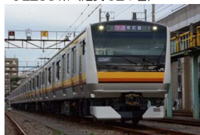
定員が1割アップする新型車両