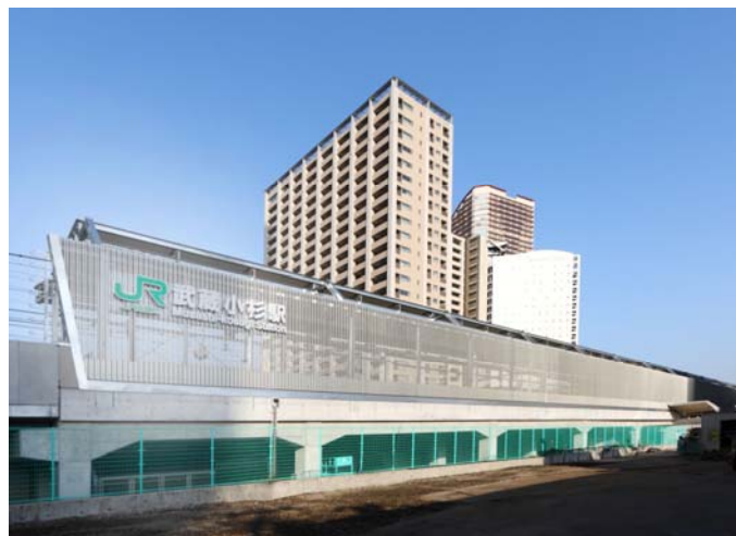
横須賀線 武蔵小杉新駅