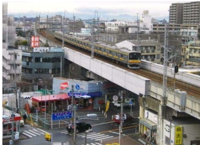
連続立体交差事業（1期）区間を走行する南武線