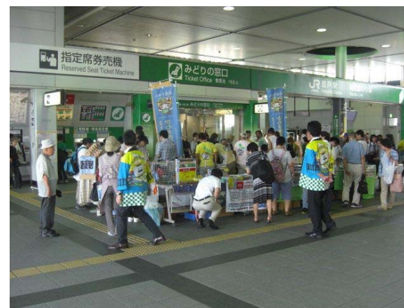
登戸駅マルシェの開催状況