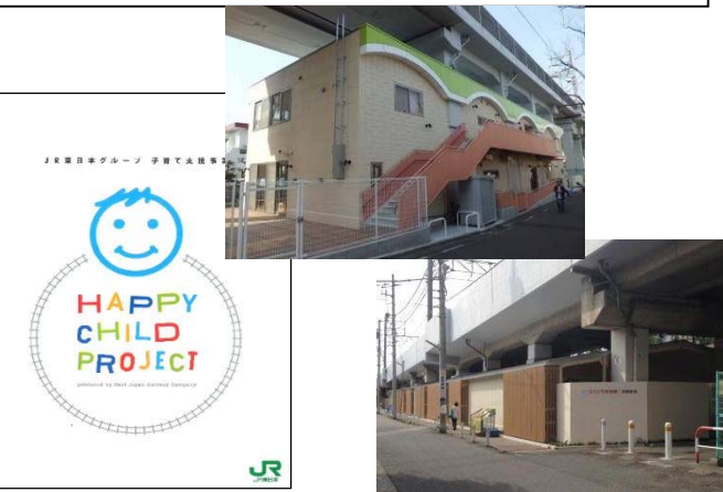
鉄道用地を活用した子育て支援施設例