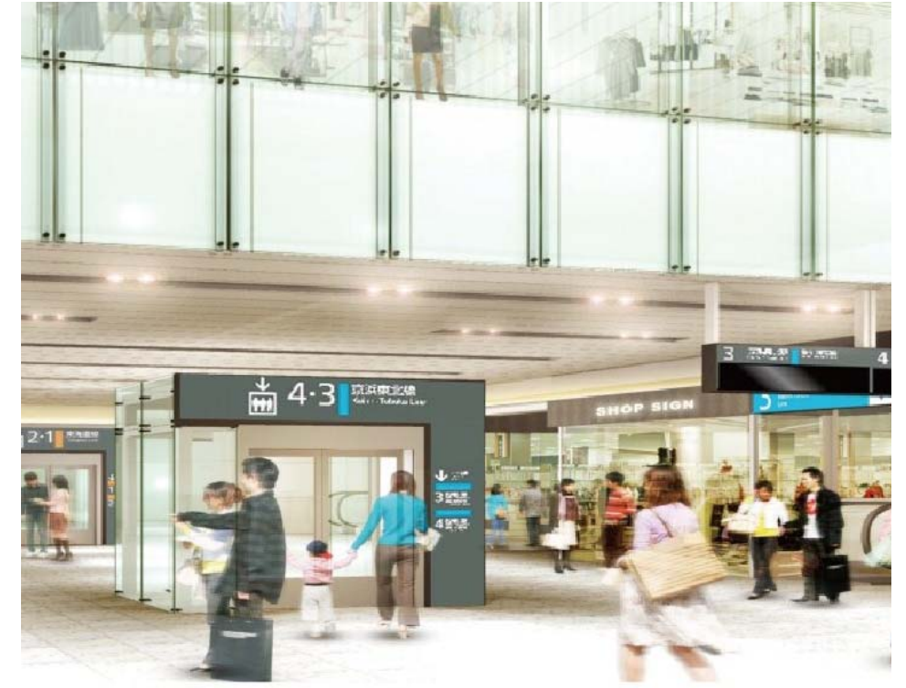
【新設コンコースのイメージ】