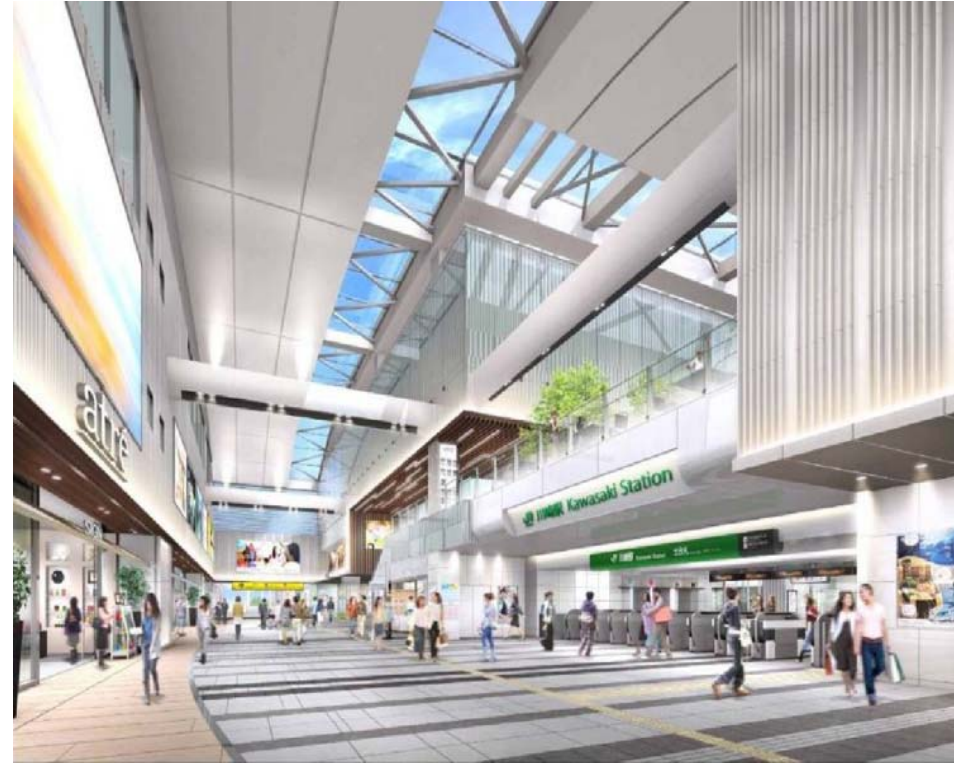
【北改札付近のイメージ】