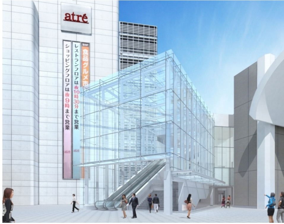
【東口駅前広場から北口自由通路をみたイメージ】