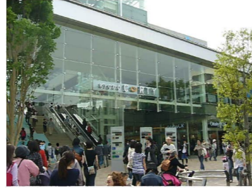
商業施設等の賑わい機能の誘導イメージ