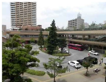
駅前広場などの交通結節機能の強化イメージ