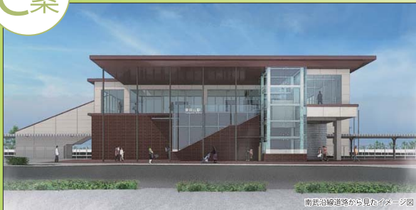
外装色のイメージ