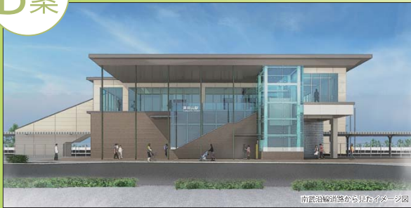
外装色のイメージ