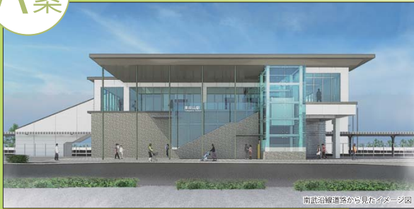
外装色のイメージ