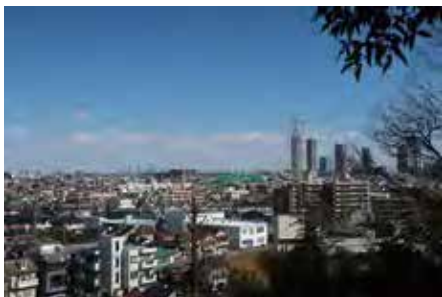
(↑ 神庭特別緑地保全地区からの眺め)

地域に親しまれている江川せせらぎ遊歩道を通り、多摩川の崖線に残る高台の緑地をめぐる散歩道です。賑やかなまちなかの水辺や、自然豊かな雑木林の緑は、人々と生き物の憩いの場となっています。