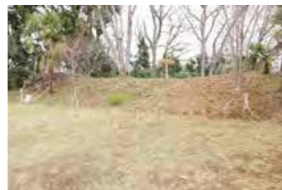
(↑ 蟹ヶ谷古墳群第1号墳)