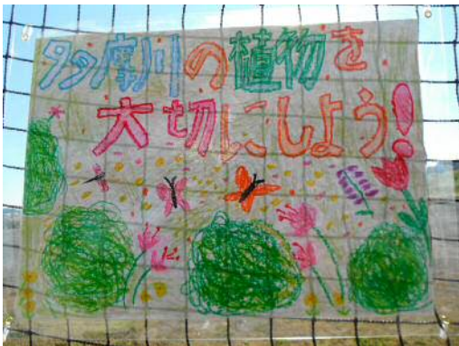
多摩川への思いを込めて描いた絵