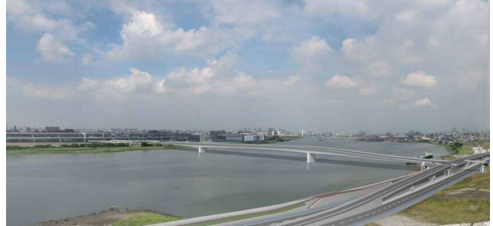
(羽田空港より多摩川上流を望む)