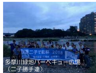
多摩川緑地パーベキュー広場 (二子勝手連)