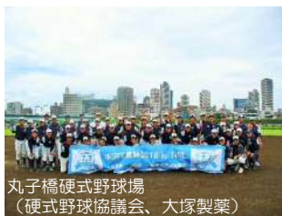
丸子橋硬式野球場 (硬式野球協議会、大塚製薬)