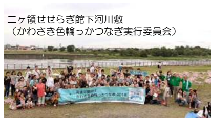
ニヶ領せせらぎ館下河川敷 (かわさき色輪っかつなぎ実行委員会)