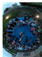
小田急線高架下付近 (登戸そだて隊)

※各乾杯スポットだけでなく、その上流の天候変化により急な増水が発生することも考えられます。 特に梅雨時期でもありますので、天候や川の流れの変化などには十分注意してください。