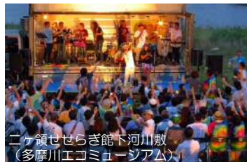
ニヶ領せせらぎ館下河川敷 (多摩川エコミュージアム)